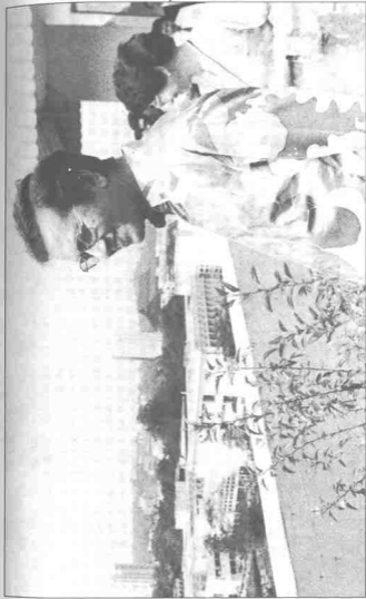
PEMBEDAHAN: Sepuluh hari selepas pembedahan jantungnya pada 24 Januari 1989, Dr. Mahathir keluar ke anjung wad khas Hospital Besar Kuala Lumpur untuk melihat panorama ibu kota.