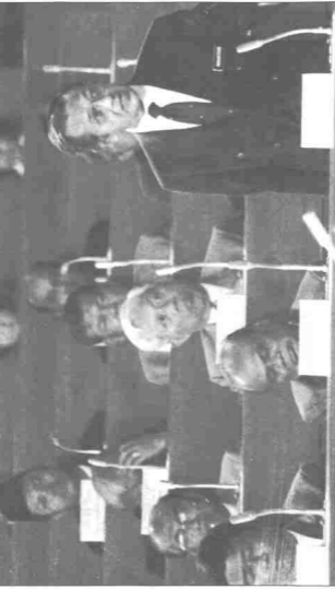
ERA BARU (Dr. Mahathir mengemukakan Rang Undang-Undang Perlembagaan (pindaan) di Dewan Rakyat pada 9 Mac 1993 yang membawa kepada penghapusan kekebalan raja-raja dan kedaulatan rakyat dalam erti kata yang sebenarnya.)