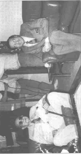
PENGHARGAAN: Walaupun diketahui umum bahawa hubungan Perdana Menteri Pertama Malaysia, Tunku Abdul Rahman Putra dengan Dr. Mahathir tidak pernah mesra tetapi Dr. Mahathir tetap memandang tinggi dan menghormati Tunku sebagai Bapa Kemerdekaan dan pengasas Dasar Ekonomi Bebas bagi Malaysia. Pertemuan Dr. Mahathir dengan Tunku di kediaman rasmi Tunku di Jalan Putra Kuala Lumpur pada 12 November 1989 dalam usaha untuk menjalin hubungan yang baik dengan Tunku.