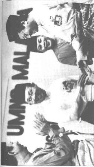
KETAWA DALAM TANGISAN: Betapa pun Tengku Razaleigh dan Musa Hitam cuba menunjukkan keriangin sambil mengucapkan tahniah kepada Dr. Mahathir yang berjaya mempertahankan percubaan mereka untuk menggulingkannya daripada pucuk pimpinan UMNO dalam pertandingan 1987 tetapi kepedihan yang tersemburyni di hati masing-masing mungkin masih belum berakhir sehingga kini.