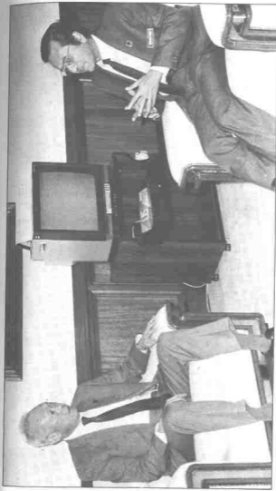
MALAY ULTRA: Perdana Menteri Singapura, Lee Kuan Yew pernah menuduh Dr. Mahathir sebagai Malay Ultra tetapi kemudiannya beliau mendapati Dr. Mahathir mempunyai banyak titik pertemuan dengannya. Dr. Mahathir dengan Lee Kuan Yew dalam satu pertemuan sempena Persidangan Ketua-ketua Negara Komanwel di Kuala Lumpur pada Oktober 1989.