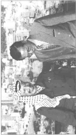
MENGENANG BUDI: Malaysia tidak putus-putus membantu perjuangan rakyat Palestin menentang Israel dan bantuan ini yang bersifat material dan moral semakin hebat semasa Dr. Mahathir. Maka itu pemimpin PLO, Yasser Arafat berasa perlu untuk mengunjungi Dr. Mahathir pada tahun 1993 sebelum berdamai dengan Israel.